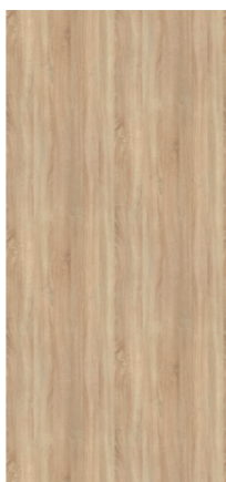
Pogled celotne plošče