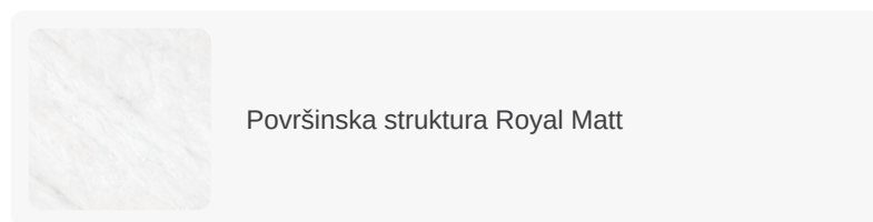
Površinska struktura Royal Matt