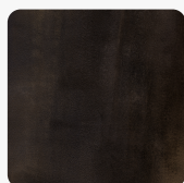
Površinska struktura Immago