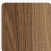
Cello 0811 NA Površinska struktura Natura